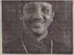
ቤተ-ክርስቲያን እና... ገጽ 12

አራተኛ ዓመት ቁጥር 202 ረቡዕ ሐምሌ 15 ቀን 2001 ዓ.ም ዋጋ 3.50