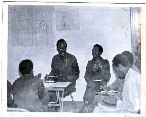
ሜ/ጄ. ረጋሣ ጅማ ባመራር ላይ፣ ተሰኔ 1970 ዓ.ም.

የዚህ መጽሃፍ ደራሲ የዋሉባቸውን የጦር ሜዳና የሥራ አካባቢዎች ከራሳቸው ገጠመኝ አኳያ በመጻፋቸው ምክንያት ሁሉንም ጀግናና ሁኔታ በዝርዝር ማውሳት እንደማይቻላቸው ግልጽ ነው። እናም በዚህ አጋጣሚ የምናነሳሳቸው ሌሎች ብዙ ብዙ ጀግናዎቻችንም በተለያዩ ጦር ግምባሮች እንደነበሩ ማስታወስ የግድ ይላል። የዚህ አስተያየት ጸሃፊ የጦር ሜዳ ጋዜጠኛ ሆኖ በዘመተበት ወቅት ያወቃቸውን አንዳንድ ጀግናዎች ዛሬም በኩራት ያስታውሳቸዋል።