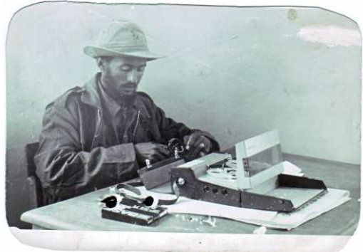
ዘጋቢው በጦር ግምባር የራዲዮ ጋዜጠኝነት ግዳጅ ላይ፣ ተሰኔ 1970 ዓ.ም.

አብረን እየተንቀሳቀሰን ነበርና፤ ድንገተኛው የጠላት ጥቃት አላያችን ላይ ወደቀ። ያኔ ነበር እኚህ ቆራጥ የጦር መሪ በያዝዋት ከዘራ እየጠቆሙ “አንተ በዚያ... አንተ በዚህ ግባ...” እያሉ ጠሩን እያስተባበሩ ወደፊት ሰንጥቆ እንዲሄድ ቆራጥ አመራርን የሰጡ። ባጭር ጊዜ ውስጥ ድብልቅልቁ በወጣው ድንገቱ ውጊያ ውስጥ የወገን ጦር እየሰነጠቀ ገፍቶ ሄዶ፣ ጠላትን መደመዱን ያጠፋውና ውጤት የጨበጠው በኒህ የቁርጥ ቀን ጀግና ነበር። በዚያ ድንገተኛ ወጊያ ጄኔራል ረጋሣ ሳይደናገጡ፣ ለአንዲት መተኪያ ለሌላት ሕይወታቸው ሳይሳሉ ፈት ለፊት ጠላትን ተጋፍጠው የኔን ብጤ ሲሸል ዘማች አይረሴ ምስል